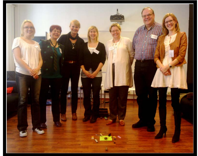
Kuvassa kevään 2012 diplomikoulutusryhmää